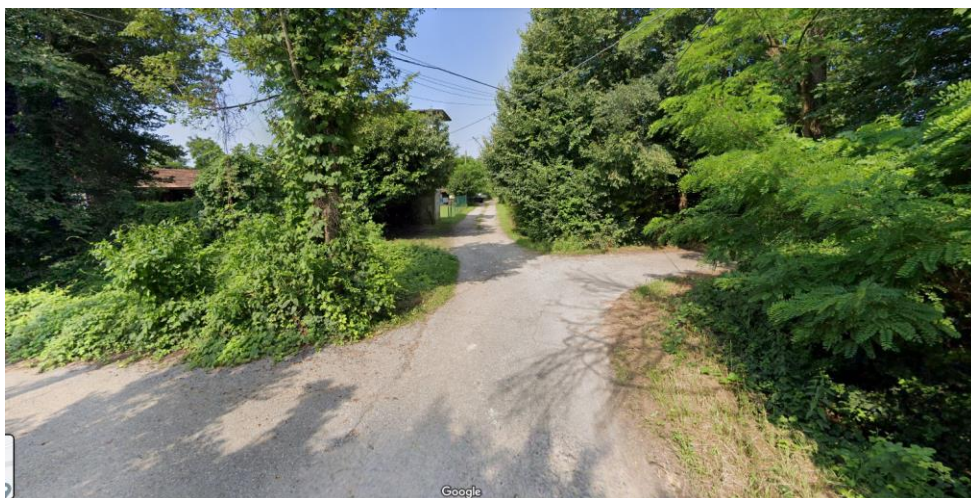
Inizio del percorso ciclopedonale Alfonsina Strada

Sul percorso risultano inseriti due accessi della Cascina Fornace Erba, al momento senza numero civico.